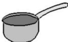
Table (fém.) : table Chaise (fém.) : chair Assiette (fém.) : plate Verre (masc.) : glass Couteau (masc.) : knife Fourchette (fém.) : fork Cuillère (fém.) : spoon Bol (masc.) : bowl Tasse (fém.) : cup Casserole (fém.) : pan Poêle (fém.) : frying pan

Réfrigérateur (masc.) : refrigerator Frigo (masc.) : fridge Évier (masc.) : sink Four (masc.) : oven Four à micro-onde (masc.) : microwave oven Plaques de cuisson (fém.) : hobs Lave-vaisselle (masc.) : dish washer Éponge (fém.) : sponge Poubelle (fém.) : trash, dustbin